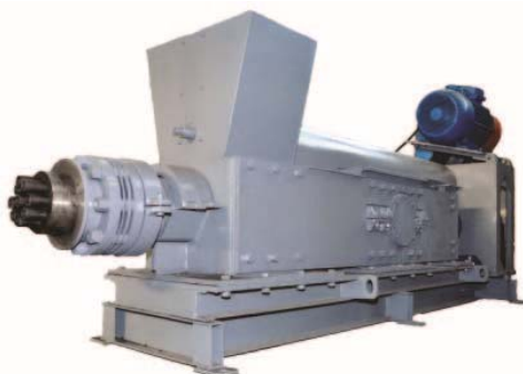
Figure 1 - Industrial screw piston press BT - 2.5-3 t/h

The operation of this equipment was studied taking into account the technological parameters of its knot. The screw is at the same time a mixing, conveying and pressing knot. The screw knot (figure 2) consists of a tubular shaft and a helical tape of welded construction.