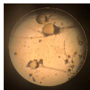
Figure 16 – Sporangia with spores of Mucor sp fungus