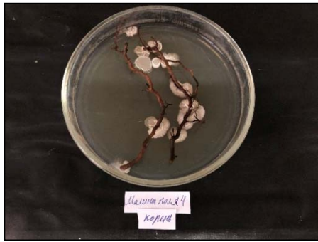
Figure 9 – Bacterial microflora on raspberry canes (nutrient medium)