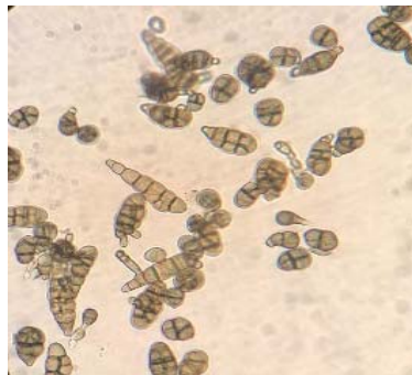
Figure 13 – Conidia of the fungus Alternaria