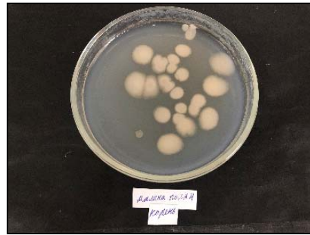
Figure 10 – Bacteria Isolated in pure culture from the root

As a result of bacteriological analysis, bacteria were isolated into a pure culture. This is dominated by fungi of the genus Didymella applanata and Fuzarium sp., fungi from the genera Aspergillus sp, Alternaria , Penicillium sp, Mucor have also been found (figure 11 – 16). Their pathogenic properties were tested on test objects-potato tubers.