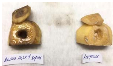
Figure 17 – Testing of pathogenic properties of bacteria isolated in pure culture on potato tubers-maceration (rot) of potato tuber

Bacteria a day later caused wet rot on potato tubers (figure 17). Maceration (decay) of potato tuber tissue (bacteria isolated from raspberry roots). According to morphological and cultural characteristics, as well as pathogenic properties, the isolated bacteria were identified as Pectobacterium carotovorum , the causative agent of soft rot.