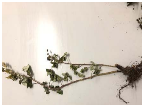
Figure 4 – Symptoms of the disease on raspberries "Bryanskoe divo»

Symptoms: on the submitted samples of raspberries affected roots, stems and leaves (figure 4). Leaves, browned along the veins, marginal necrosis.