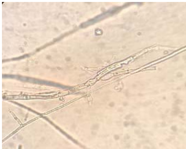
Figure 11 – Mycelium of the fungus Didymella applanata

As a result of bacteriological analysis, bacteria were isolated into a pure culture. This is dominated by fungi of the genus Didymella applanata and Fuzarium sp., fungi from the genera Aspergillus sp, Alternaria , Penicillium sp, Mucor have also been found (figure 11 – 16). Their pathogenic properties were tested on test objects-potato tubers.