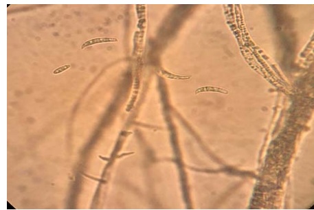
Figure 12 – Conidia of the fungus Fuzarium sp