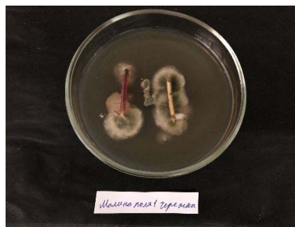
Figure 8 – Fungal and bacterial microflora on raspberry leaf petioles (nutrient medium)