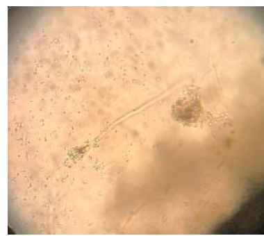
Figure 14 – Conidia of the fungus Penicillium sp