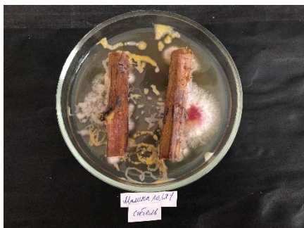
Figure 7 – Bacterial and fungal microflora on raspberry branches (nutrient medium)

The results of phytopathological analysis showed that raspberry plants are infected with fungal and bacterial microflora (figure 7,8 and 9,10).