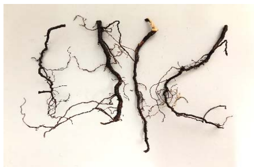
Figure 6 – Symptoms on the roots of raspberry

Classical phytopathological methods were used for the phytopathological diagnosis of raspberry disease. Determination of fungal and bacterial microflora was carried out by morphological and cultural characteristics of the colony of fungi and bacteria isolated in pure culture. Raspberry branches on the nutrient medium potato agar (KA) and in a wet chamber, when cultivated in a thermostat at 25-26C for 5-7 days.