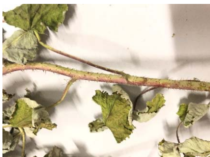
Figure 5 – Symptoms on stems and petioles of raspberry

The berries shrivelled. On the stem was ringed with a purple coloration along the stem. On some parts of plants and leaf petioles unilateral purple color (figure 5). Roots poorly developed, browned, maceration of lateral roots (figure 6).