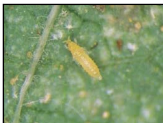
Figure 1 – Raspberry leaves "Bryanskoe divo" nymphs thrips council

As a result of the analysis, eggs and imagos of ticks, lozhnoshitovki, nymphs of thrips, pupari of whiteflies, and beetles-weevils were found on raspberry leaves (figures 1,2,3). No pests or nematodes were found in the soil.