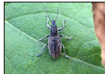
Figure 3 – Imago weevil's