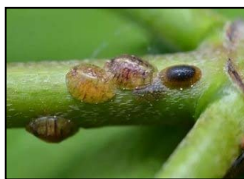
Figure 2 – False Whiting in raspberry samples