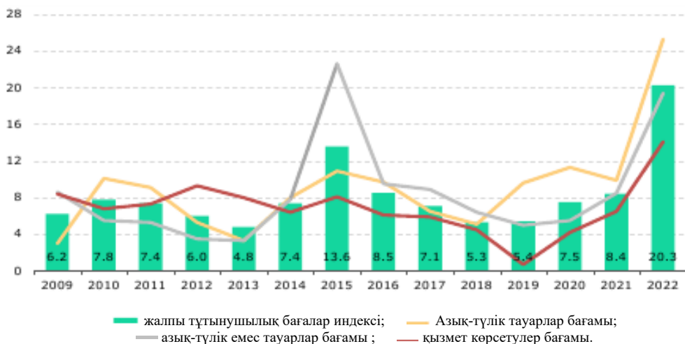
Сурет 2 - ҚР-дағы инфляция және оның компоненттерінің бөлінісі

жылдар бойы негізгі үлесті азық-түлік тауарларына баға өсімінің орын алғандығын көреміз, бұл тұтыну себетінің құрамында шамамен 40% салмағына ие, сондай-ақ келесі кезекте азық-түлік емес тауарлар сызығы да басымдыққа ие, соңынан қызмет көрсету бағаларының өсімі берілген (Temirhanov, et al., 2023).